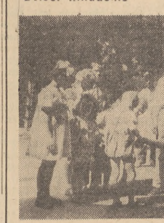
Parowiec „Stawropol” przywiózł do portu odeskiego dwa słońki, przybrane przez premiera Indii J. Nehru jako dar dzieci hinduskie dla dzieci radzieckich.

Na zdjęciu: dzieci zawierają znajomość ze słońkami Rawi (Słońce) w ogrodzie zoologicznym w Odessie.