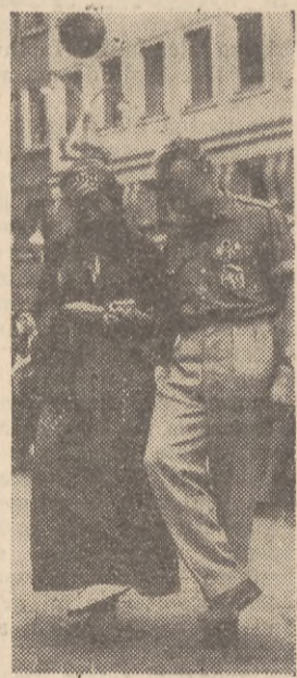
Delegatka młodzieży li. bańskiej uczy swoich tańców młodego Czecha.