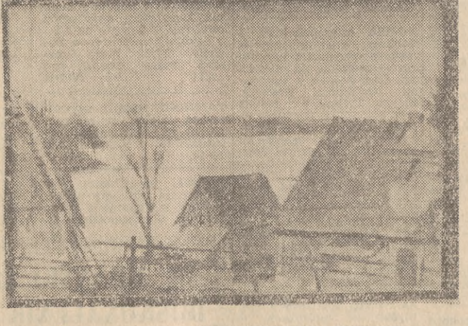
„Chalupy nad jeziorem” - malował Jerzy Piotrowski