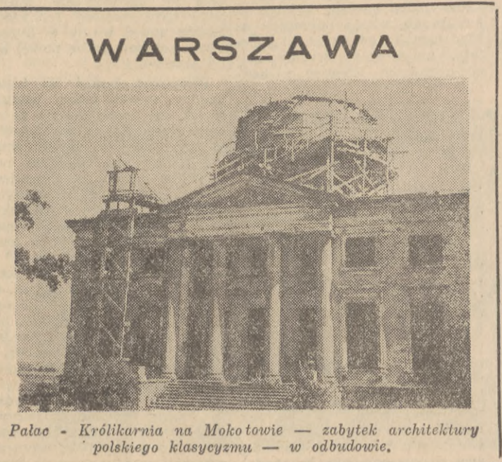
Pałac - Królikarnia na Mokotowie — zabytek architektury polskiego klasycyzmu — w odbudowie.