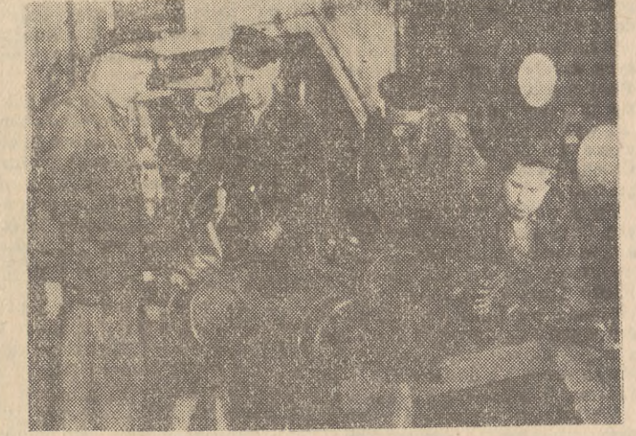
...do skończył „zawaleniem” planu, ale zakończyło się jego przekroczeniem...