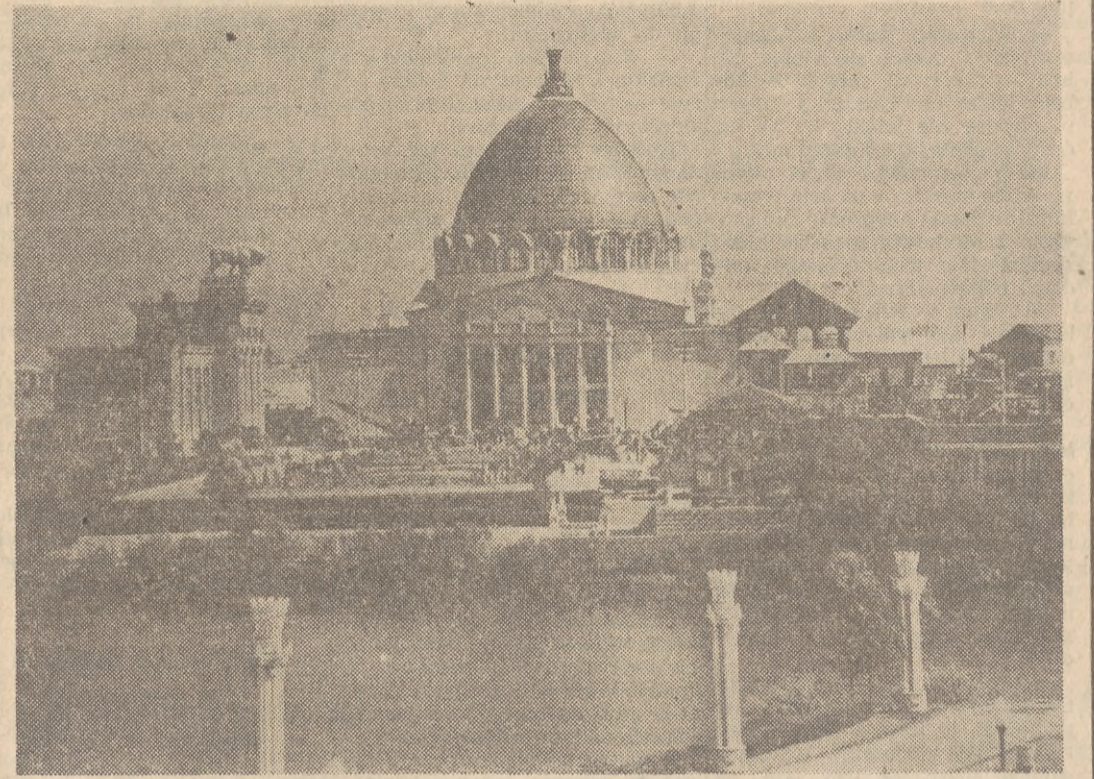
Na zdjęciu: Pawilon mechanizacji i elektryfikacji rolnictwa ZSRR.