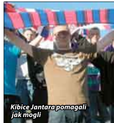
Kibice Jantara pomagali jak mogli

W IV lidze (grupa pomorska) znów nastąpiły zmiany. Do niedawna zdawało się, że po dwóch walkowerach z walki o III ligę odpadła drużyna Pomorza Potęgowa. Tymczasem, Związkowa Komisja Odwoławcza Pomorskiego Związku Piłki Nożnej jeden wniosek oddaliła, a w przypadku drugiego uchyliła decyzję pierwszej instancji. W meczu ze Startem Mrzezino walkower pozostał, natomiast w meczu z Pogonią Prabuty uznano wynik z boiska i 3 punkty wróciły do Pomorza. Tym samym drużyna z Potęgowa, wygrywając 1:0 w ostatnim pojedynku z Pomezianą Malbork, wróciła do gry o III-ligową premię. Najprawdopodobniej z walki tej odpadł już Jantar Ustka, który na finiszu rozgrywek nie radzi sobie. Przegrał ostatnio trzy mecze pod rząd, a najdotkliwszą porażką jest ta z Karolem Pęplino, drużyną która tylko cudem może uratować się przed degradacją do okręgówki. I chociaż ustecy kibice pomagali swojej drużynie jak mogli, śpiewając nawet piosenki biesiadne, to na nic się zdały ich wysiłki, Jantar poległ, z drużyną, którą w pierwszej rundzie rozgrywek w Pęplinie, łatwo pokonał 3:0. Przyjezdnym udało się rewanż i to w