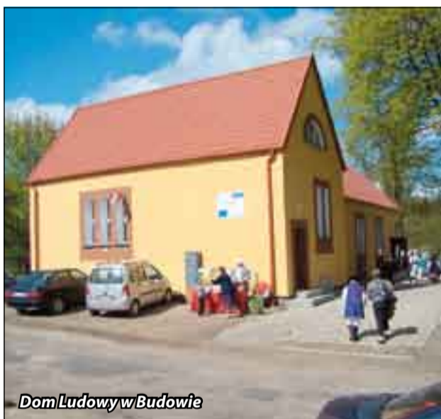
Dom Ludowy w Budowie