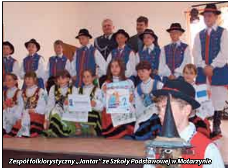
Zespół folklorystyczny „Jantar” ze Szkoły Podstawowej w Motarzynie