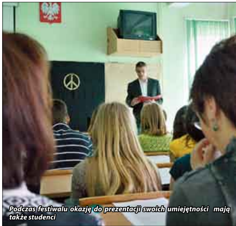
Podczas festiwalu okazję do prezentacji swoich umiejętności mają także studenci

Większość propozycji ma charakter edukacyjny. Pracownicy dydaktyczni słupskiej uczelni będą starali się przybliżyć potencjalnym studentom – również pracującym już nauczycielom – problematykę swoich aktualnych zainteresowań i zapoznać z możliwościami technicznymi kształcenia. Nie zabraknie pokazów multimedialnych oraz zajęć z wykorzystaniem takich form jak zabawa czy gra, a w sali sportowej AP odbędzie się nawet licealiada. Tradycyjnie już wyjątkowo widowiskowo zapowiadają się propozycje chemików i fizyków. Również słupscy matematycy postarają się zaprzeczyć powszechnemu przekonaniu o wyjątkowych trudnościach związanych z pojmowaniem tajników ich nauki. Przedstawiciele nauk medycznych będą metodami wykładowymi i rekreacyjnymi uświadamiać festiwalowym gościom jakie zagrożenia dla zdrowia czyhają na każdego w najmniej niewinnych zdawałoby się zjawiskach. W propozycjach programowych nie pominięto również roli środowiska naturalnego i właściwych relacji z nim człowieka. Historycy zapowiadają, że nie tylko odsłonią kolejne tajemnice przeszłości, ale i ożywią historię.