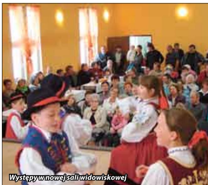
Występy w nowej sali widowiskowej