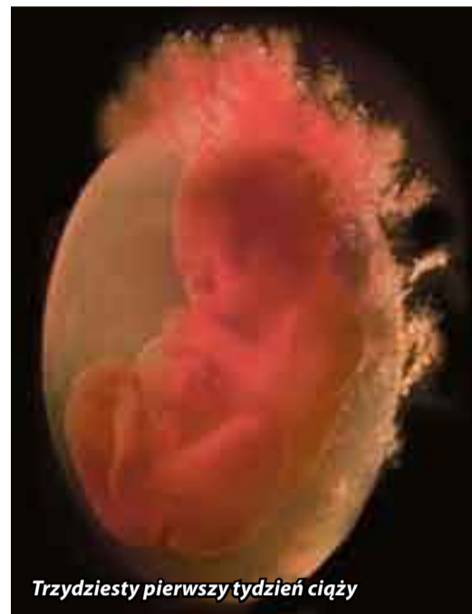
Trzydziesty pierwszy tydzień ciąży

W 2010 roku w Polsce przyszło na świat 418 tysięcy dzieci. Ponad 26 000 z nich urodziło się w województwie pomorskim. Według danych Departamentu Badań Demograficznych GUS 66% noworodków w Polsce, czyli prawie 278 tysięcy, przyszło na świat za pomocą dróg natury, pozostałe 34% – przez cesarskie cięcie. To ponad dwa razy więcej niż średnia ustalona na poziomie 15% przez Światową Organizację Zdrowia