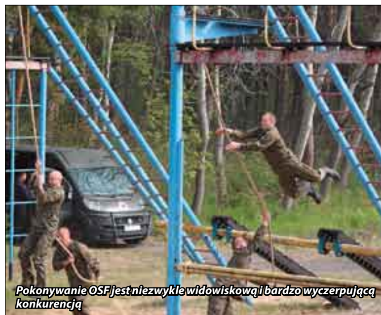
Pokonywanie OSF jest niezwykle widowiskową i bardzo wyczerpującą konkurencją