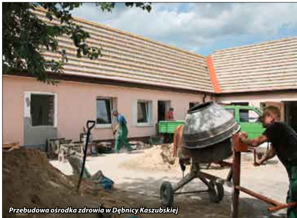
Przebudowa ośrodka zdrowia w Dębicy Kaszubskiej