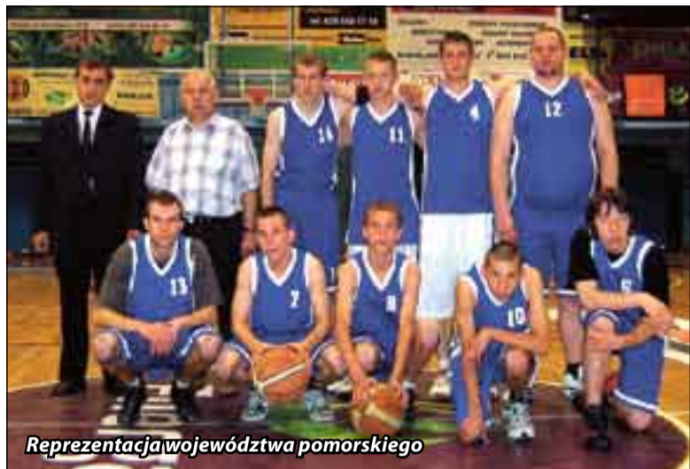
Reprezentacja województwa pomorskiego